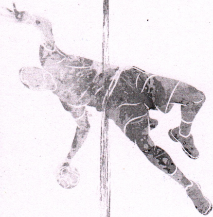
ТАБЛИЦА Первенства Минской области по гандболу среди юношей 2009–2010 гг.р. 28 – 29 марта 2022 года, г. Солигорск